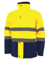
AMARILLO AV/ AZUL MARINO