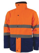
NARANJA AV/ AZUL MARINO