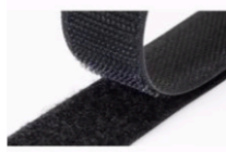
Cierre de Velcro